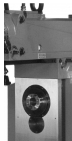
OPCIÓN Husillo Frontal