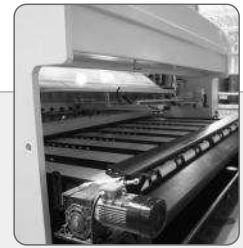
SISTEMA DE DESCARGA